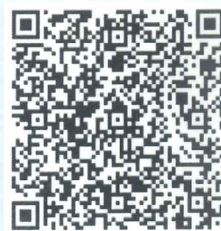
平湯温泉スキー場