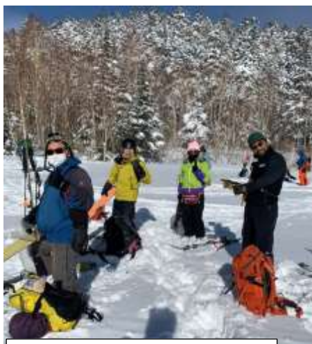
好天のもと、休憩も楽しく

1/31(日) 乗鞍高原スキー場のリフトトップ2000mから2800m位まで歩き、そこから滑走。ガイドの案内で難しい伊那谷コースを気持ち良く滑りました。