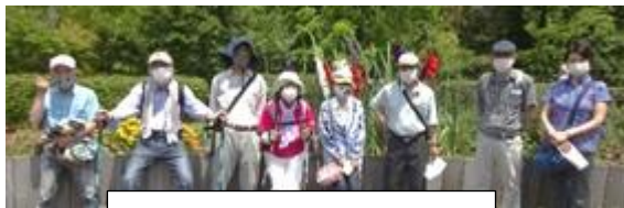
グラジオラスをバックに