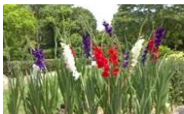
色とりどりのグラジオラス