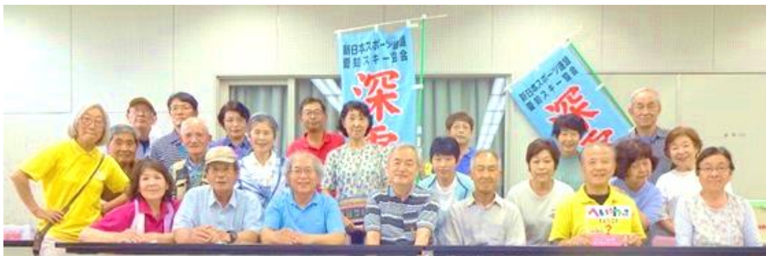
クラブの旗の前で記念写真 この時だけはマスクをはずしました

雨が心配されましたがすっかり天気になり、予定どおり聚楽園公園をウォーキングしました。目玉は途中、嚶鳴庵茶室での呈茶（菓子付き350円）です。2つのグループに分かれて別々のコースを歩きました。私たちは途中で色々な花が咲いていて、写真を撮ってゆっくりしてしまいました。花の名前は写真を撮ってスマホのグーグルで検索すればいいとスマホを十分活用している最年長の会員の方から教えて貰いました。スゴイ！。