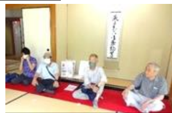
茶室でくつろいでいます

雨が心配されましたがすっかり天気になり、予定どおり聚楽園公園をウォーキングしました。目玉は途中、嚶鳴庵茶室での呈茶（菓子付き350円）です。2つのグループに分かれて別々のコースを歩きました。私たちは途中で色々な花が咲いていて、写真を撮ってゆっくりしてしまいました。花の名前は写真を撮ってスマホのグーグルで検索すればいいとスマホを十分活用している最年長の会員の方から教えて貰いました。スゴイ！。